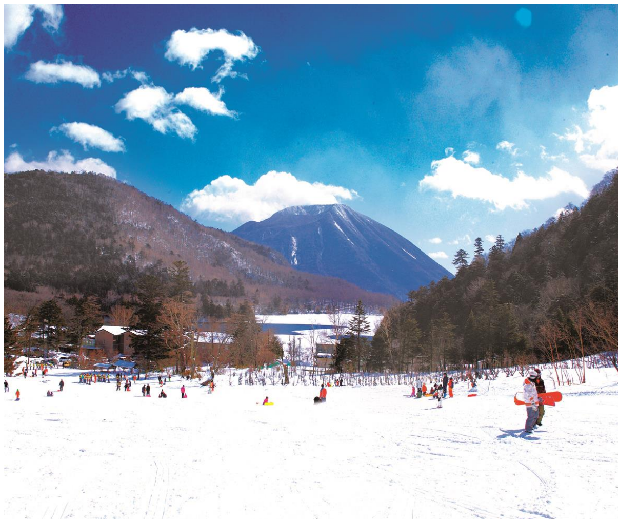
【日光湯元スキー場】