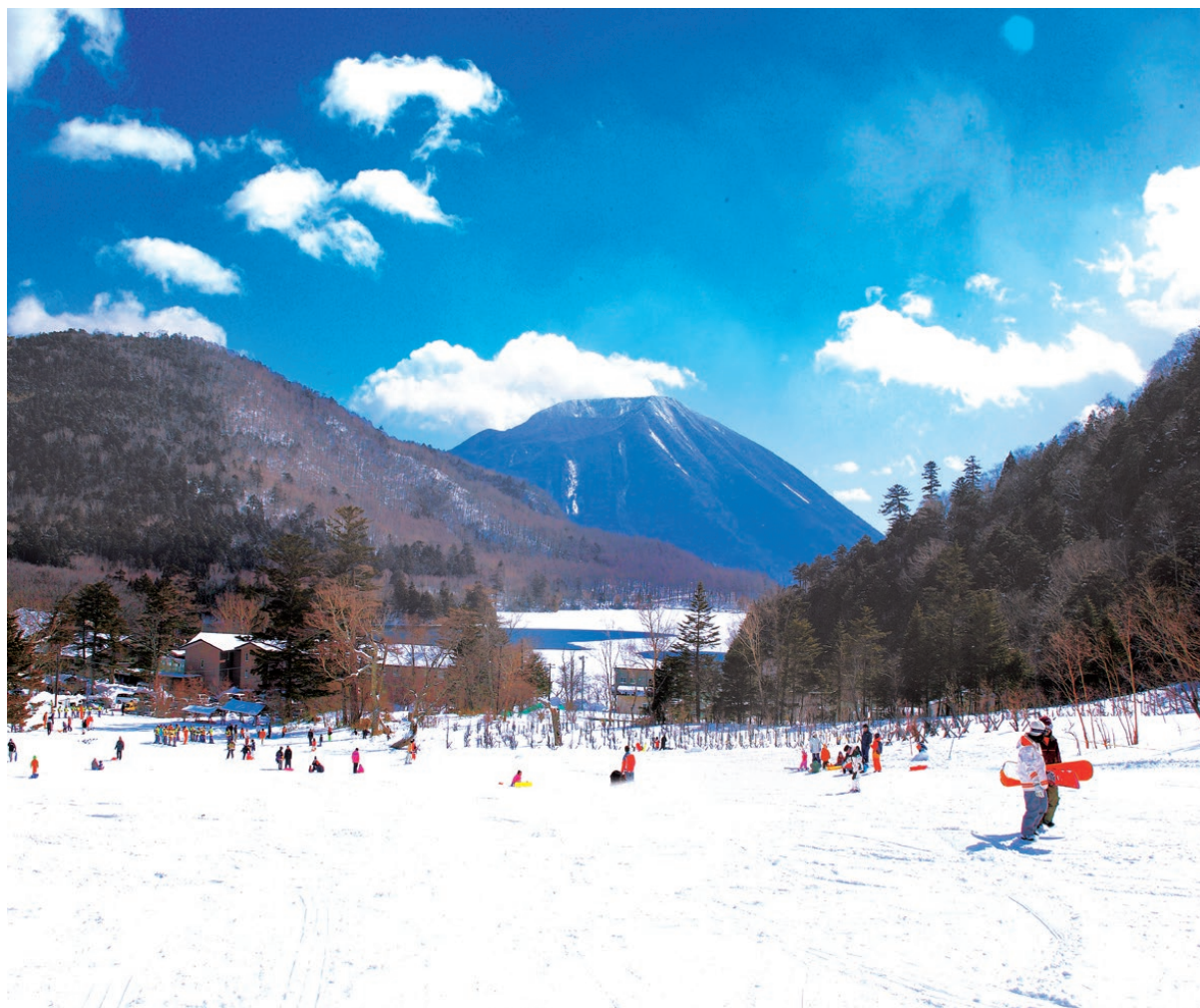
【日光湯元スキー場】